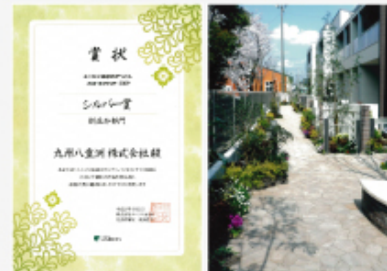
株式会社ユニゾン西日本主催