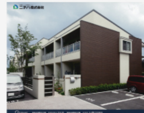
ニチハ株式会社主催