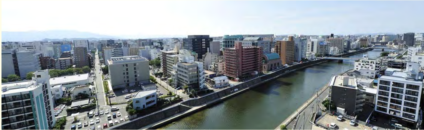
※現地14階バルコニー部分からの眺望(平成24年9月撮影)

快適なアクセスは、時間を生み出す要。地下鉄駅へ1分、地下鉄を使って福岡都心を自由に満喫できる「ジョイナス東比恵」。 日当りの良さ、高度なセキュリティ、充実した設備仕様にこだわった住品質も、都心生活をサポートします。