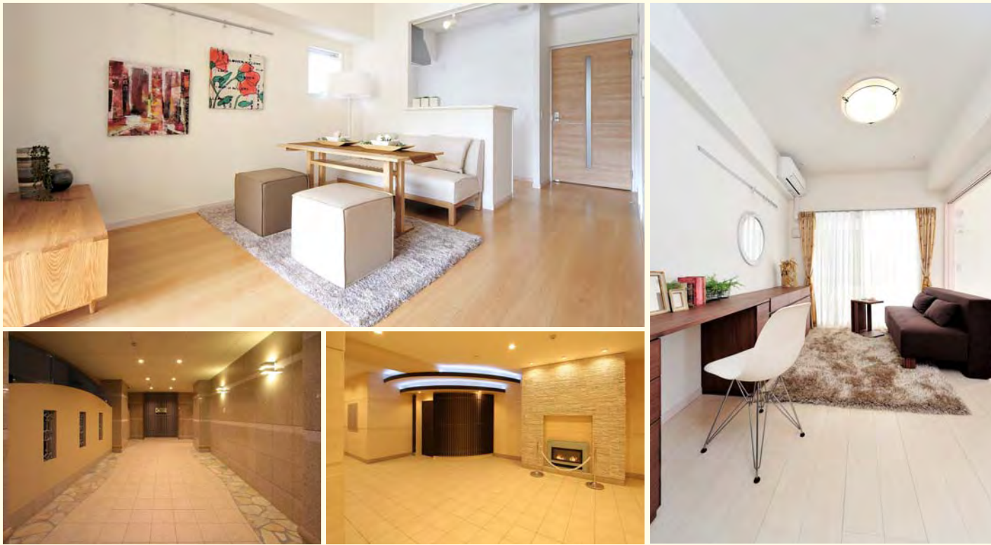
※上記は、棟内モデルルームを撮影したもので、実際には、家具・小物についてはありません。(平成24年9月、平成25年2月撮影)